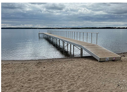
Fine badefaciliteter ved stranden